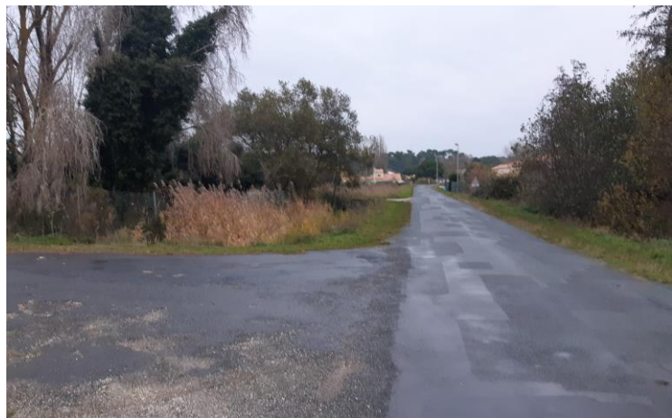
Photo 2 : Bd. De Gatseau depuis l'entrée de la station d'épuration (Novembre 2021)