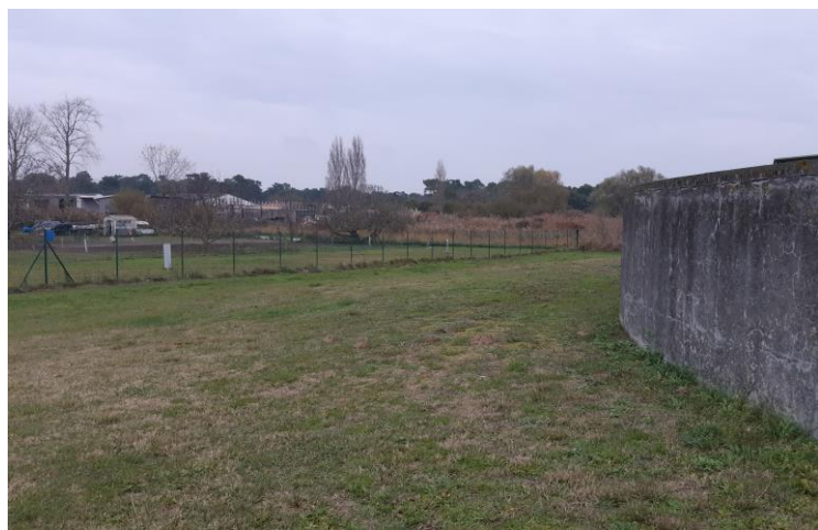
Photo 4 : Vue de l'environnement Nord de la parcelle d'implantation de la station d'épuration (Novembre 2021)