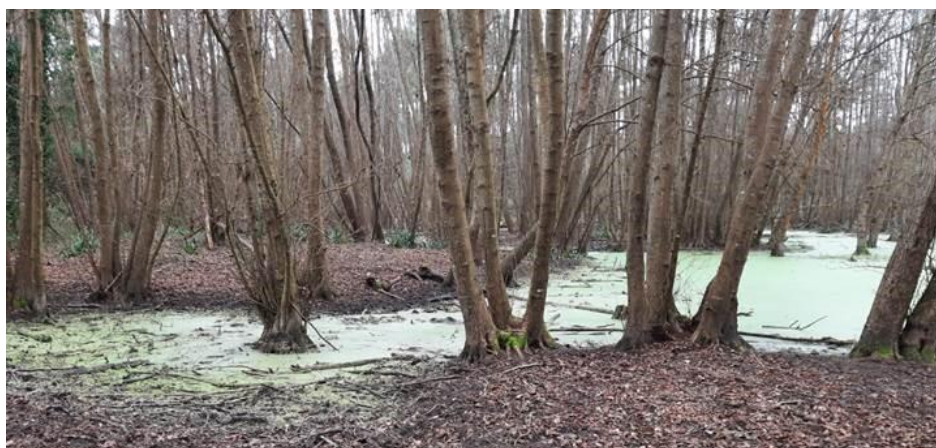
Photo 7 : Milieu récepteur de la lagune d'infiltration dunaire (Février 2022)